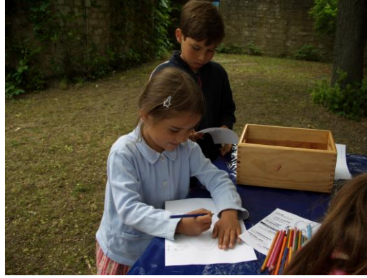
Der Sohn läuft viele Irrwege, wir malen den Weg!