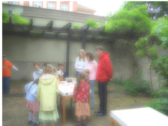
Wer kann den Esel am höchsten bepacken?