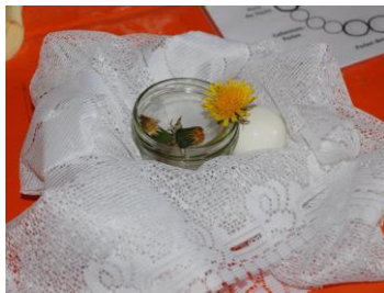
Perle der Auferstehung