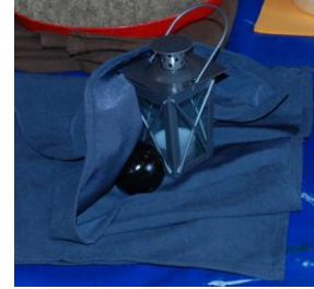
Perle der Nacht