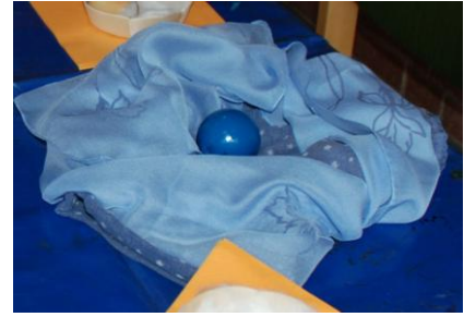
Perle der Gelassenheit